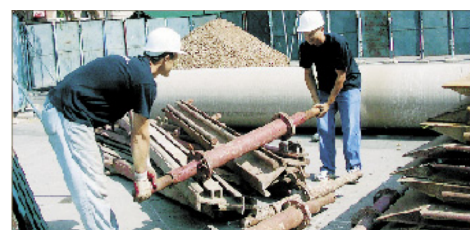
U građevinarstvu je dosta rada na crno

S njim se slaže i odvjetnik Zvonimir Hodak, koji je dodao da na odgovornim mjestima u Ministarstvu pravosuđa sjede ljudi koji se ne razumiju u pravo.