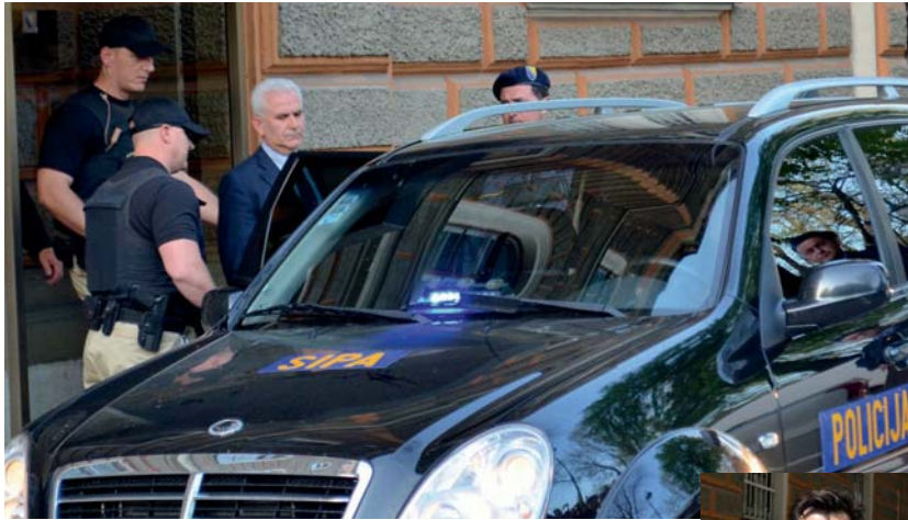
Službenici SIPA-e odveli su Živka Budimira bez listica iz zgrade Predsjedništva BiH

Predsjednik FBiH Živko Budimir je uhićen u okviru akcije “Patriot”, a izmđu ostalog na teret mu se stavlja primanje mita u svrhu pomilovanja određenih osoba. U okviru “Patriota” također je uhićen još devet osoba na osam lokacija. Sve osobe uhićene u ovoj akciji dovode se u vezu s krivičnim djelom podmičivanja i krivičnog djela protiv službene i dru-