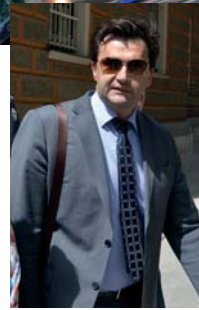
Tužitelj Oleg Čavka

Akcija je nastavljena i tijekom prošle noći, pretreseni su neki privatni stanovi i kuće u nekoliko mjesta u Federaciji. Kako doznajemo, akcija se nastavlja i danas.