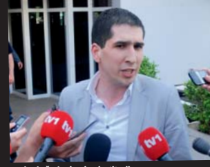
Kaplan kaže da vjeruje u institucije