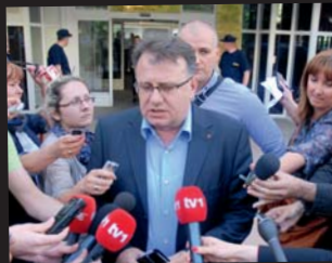
Nikšić pozdravio akciju