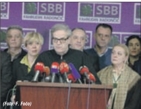
Press SBB-a BiH sinoć: Brutalna zloupotreba institucija i poluga pravosudnog sistema