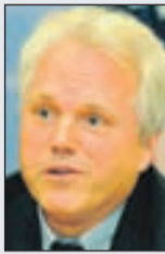
Hil: Otkrio pravo stanje

- Da bi trajno učvrstilo reputaciju vjerdostojne institucije,