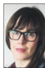
Gojković-Arbutina: Sve je teže raditi novinarski posao

- Ordiniranje s dugim cijevima u bilo kojoj redakciji je neprihvatljivo i nema razumnog objašnjenja za to, jer su ušli u