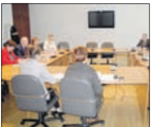
Razgovarano o saradnji