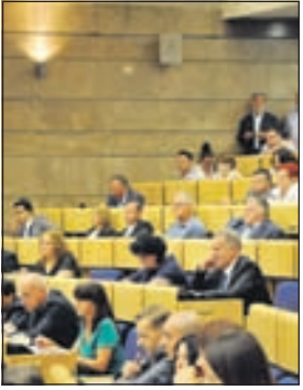
Predstavnički dom: Izmjene zakona