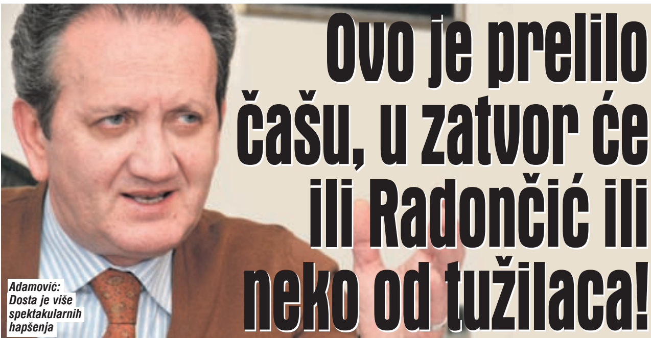
Adamović: Dosta je više spektakularnih hapšenja