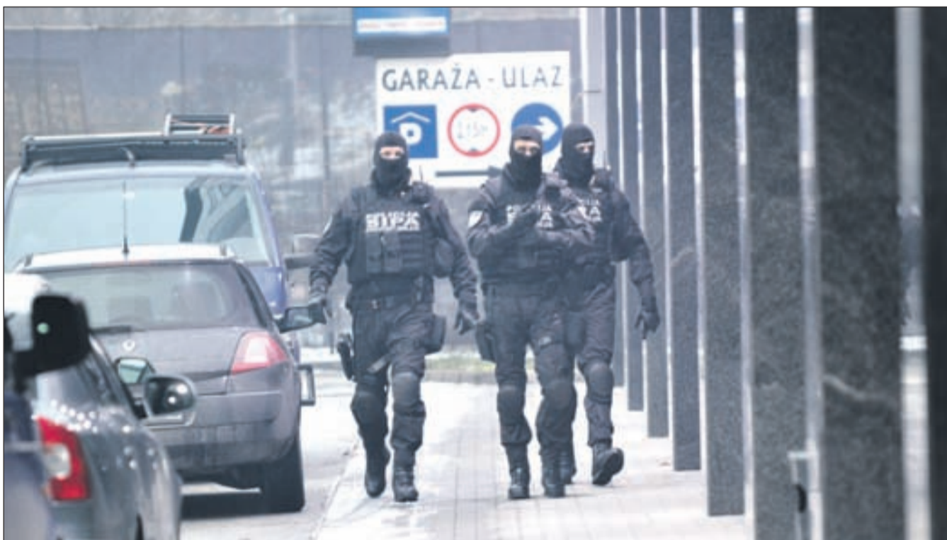
Specijalci SIPA-e ispred zgrade u kojoj je smještena redakcija „Avaza“

za“, među iznenađene novinare i urednike, već su upali do zuba naoružani specijalci u pratnji inspektora s revolverima za pasom. Mi samo radimo svoj posao, kazali su nam specijalci s maskama, vjerovatno da se onako ljudski opravdaju što su silom prilika dio harange.