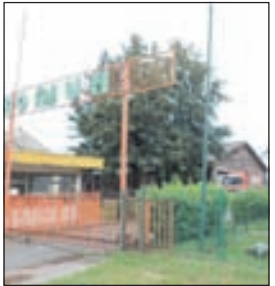
Konjuh: Rješavanje problema