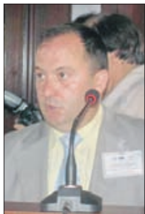
Vejnović: Eminentna medijska kuća

istrage niko ne spori te da susamo metode sporne.