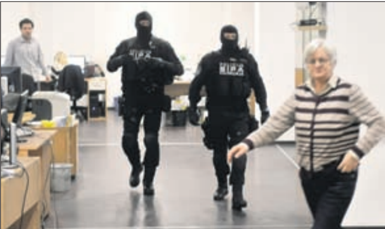
Specijalci SIPA-e u redakciji „Dnevnog avaza“: Neće nas uplašiti

Advokat Barbarić: Radončić mi je rekao da je ovo politički montirani proces ● SBB: Neviđen pokušaj eliminacije političkih protivnika ● Adamović: Ovo je prelilo čašu ● Brutalan policijski upad u redakciju „Dnevnog avaza“