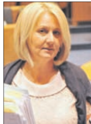
Krišto: Raditi u skladu sa zakonom