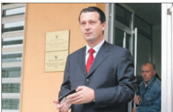
Barbarić: Traže nešto čega nema

- Nešto se ovdje traži čega nema. Radončiću stavljaju na teret ometanje pravde, u vezi s procesom koji se vodi na Kosovu. Tu se traže neki