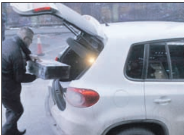
Inspektori SIPA-e: Radili po nalogu Tužilaštva

U trenucima kada je saopćenje odaslano medijima, u redakciju „Dnevnog avaza“