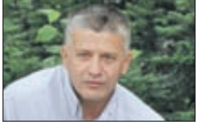
Orić: Tereti se za ratne zločine