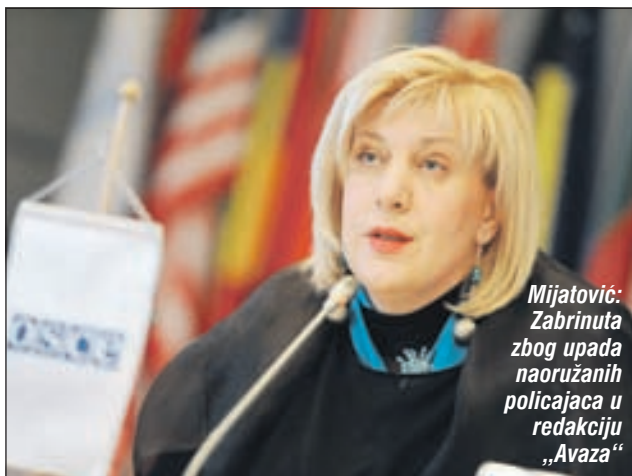
Mijatović: Zabrinuta zbog upada naoružanih policajaca u redakciju „Avaza“

- Pratim sa zabrinutošću policijski pretres redakcije „Dnevnog avaza“. Prisustvo naoružanih policajaca u prostorijama dnevnih novina je posebno zabrinjavajuće. Iako, kako shvatam iz saopćenja policije, ovaj pretres nije u vezi s radom medija, ovakve akcije imaju veoma negativne pos-