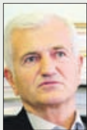
Prof. Fočo: Nespojivo s demokratskim procesima

- U posljednje vrijeme SIPA, rekao bih sasvim sigurno, previše koristi silu i oblike zastrašivanja, ne samo u „Avazu“ nego prilikom hapšenja bilo kojeg čovjeka prevelika sila se upotrebljava. To je nespojivo s demokratskim procesima, jer