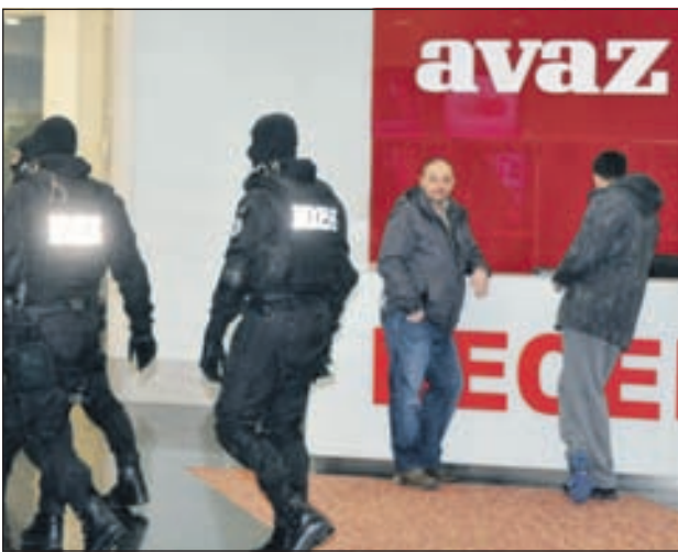
Vijeće za štampu: Demonstracija sile