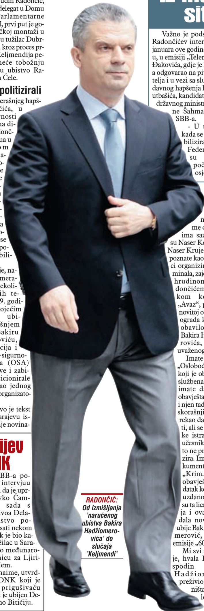
RADONČIĆ: Od izmišljanja 'naručenog ubistva Bakira Hadžiomerovića' do slučaja 'Keljendi'

Tada je, naime, utvrđeno da je DNK koji je nađen na prigušivaču oružja kojim je ubijen Delalić pripadao Bitićiju.