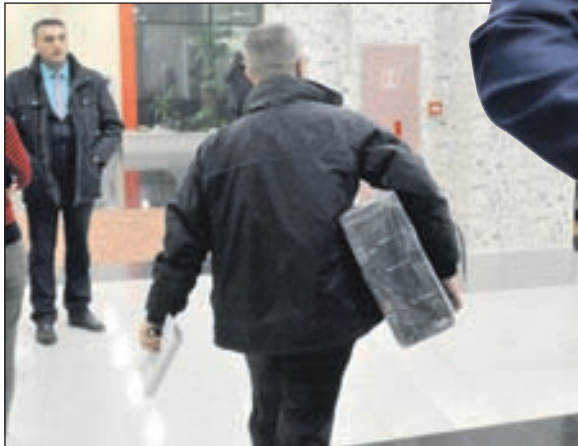
Iznošenje kompjutera iz redakcije našeg lista