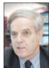
Đonlagić: Krizna situacija

- Na prijedlog predsjednika SDA Bakira Izetbegovića organiziran je sastanak delegacija SDA i SBB-a povodom novonastale situacije