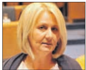
Krišto: Ovakve stvari nisu dobre