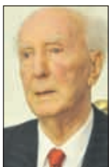
Filipović: Teško povjerovati