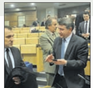
Sa sjednice: Koalicija trenutno neupitna

- Ovo hapšenje destabilizira u ovom trenutku političke prilike u Federaciji. Koliko je ono opravdano, a koliko nije, o tome će odlučivati pravosudni organi. SDA podržava sve organe da poduzimaju mjere koje smatraju da su potrebne, ali one moraju biti zasnova-