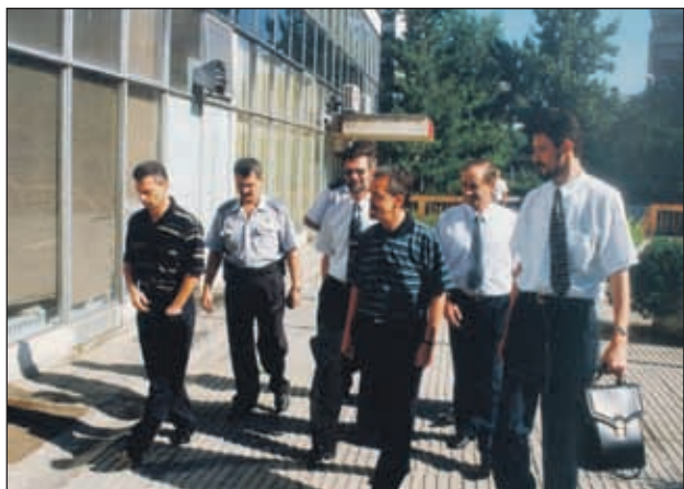
U ranu zoru 6. juna 2000. godine, oko 4.15 sati, šest poreznih policajaca upalo je u štampariju „Dnevnog avaza“, a deset dana kasnije računi „Dnevnog avaza“ su blokirani te su dan kasnije u prostorije „Avaza“ upali porezni inspektori uz, kako je kasnije dokazano, nezakonitu pratnju federalnih policajaca

Tačnije, 6. juna u ranu zoru, oko 4.15 sati, šest poreznih policajaca upalo je u štampariju „Dnevnog avaza“, zabranivši grafičarima i osiguranju upotrebu telefona. No, pokušaj zaustavljanja rotacije i sprečavanja redovnog izlaska našeg