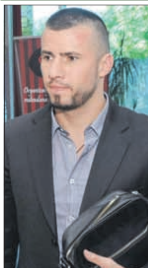
Beljo: Rad bez pritiska