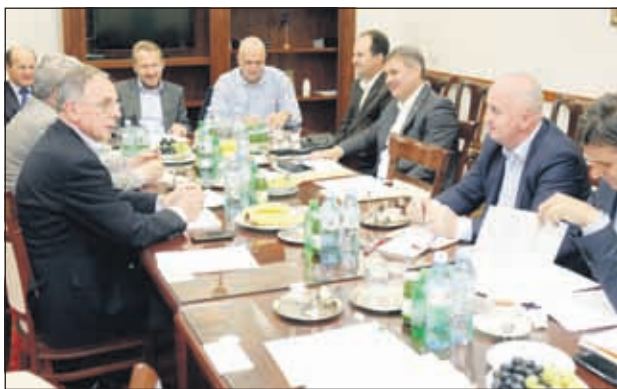
SDA: Ozbiljan izazov za novouspostavljenu koaliciju

- Vjerujemo da su pravosudne institucije svjesne ovih okolnosti, te da će svoj posao obaviti u najkraćem mogućem roku uz striktno poštivanje Ustava, zakona kao i vlastitih obaveza i odgovornosti, te o nalazima obavijestiti javnost. SDA poštuje presumpciju nevinosti po kojoj niko nije kriv