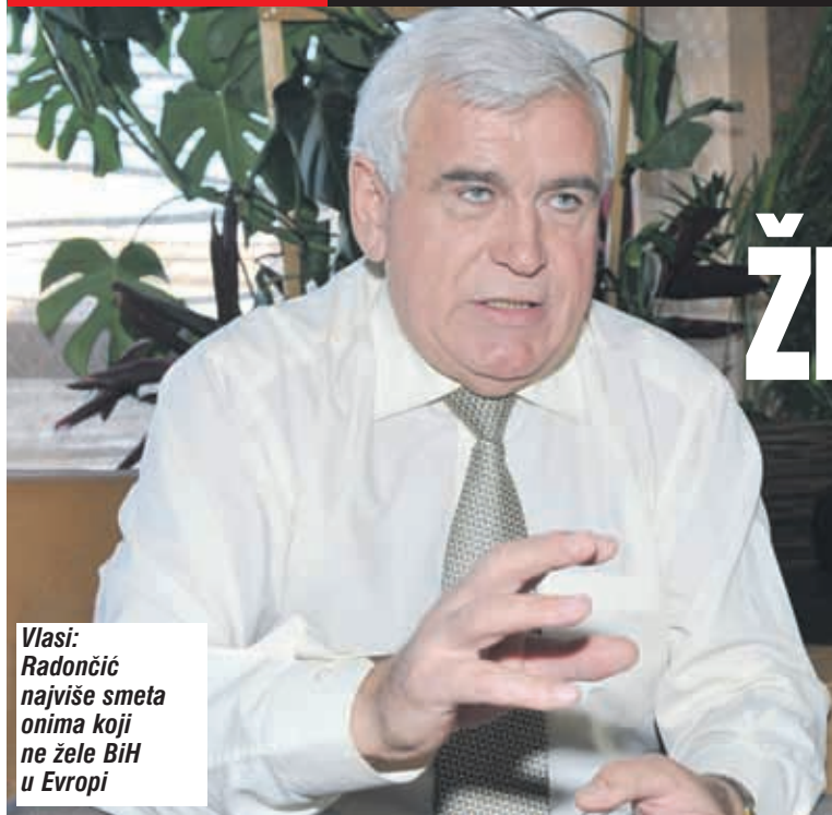
Vlasi: Radončić najviše smeta onima koji ne žele BiH u Evropi

Azem Vlasi, politički analitičar i advokat, za „Dnevni avaz“