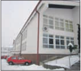
Prva osnovna škola: Nema bojkota