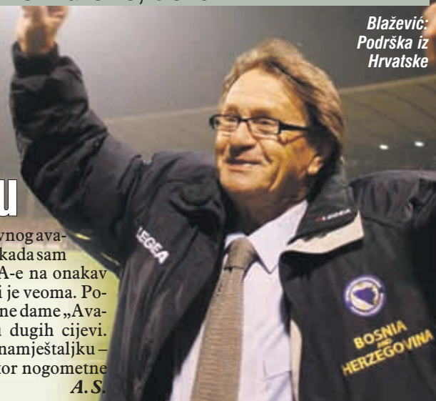
Blažević: Podrška iz Hrvatske

- Podrška novinarima „Dnevnog avaza“ iz Hrvatske. Zgrozio sam se kada sam čuo da su vam pripadnici SIPA-e na onakav način upali u redakciju. Žao mi je veoma. Posebno što su novinarke, prekrasne dame „Avaza“, morale raditi u prisustvu dugih cijevi. Ovo mi sve miriše na političku namještaljku – kaže Ćiro Blažević, bivši selektor nogometne reprezentacije BiH.