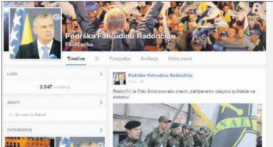
Facebook grupa "Podrška Fahrudinu Radončiću: Hiljade članova"

U toku jučerašnjeg dana podršku Radončiću, potpisivanjem peticije, pružili su