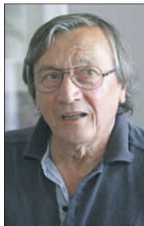
Zec: Potresen sam i žalostan

- Čitao sam sve... Ne znam jesam li ja prava osoba da o tome govorim, možda mogu govoriti o opštim stvarima, ne i ličnostima. Sve ovo što se dešava zapravo je veoma tužno, nikako da imamo vladu i zemlju da sve to nekako redovno i normalno ide. Sve je dramatično. Ta agonija Bosne traje godinama. Svako normalan se pita: „Šta je ovo? Šta se dešava?“ Gospodina Radončića nisam nikada upoznao, „Dnevni avaz“ čitam godinama i sve skupa što se dešava me potresa i žalosti. Svi mi čekamo, zapravo želimo neka vremena i situaciju u kojoj će nam biti omogućeno da radimo, da se dignemo iz ovog kalamaj i blata u kojem smodocenijama.