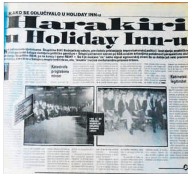
Pozadina Radončićevog progona od 1993. godine najbolje se može shvatiti ako se prisjetimo njegovog čuvenog teksta „Harakiri u Holiday Inn-u“, koji je Radončić objavio u prvom broju „Bošnjačkog avaza“