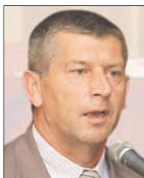
Hasanović: Kriminalcima daju pare da svjedoče

Kako je poznato, Naser Orić je dan uoči općinskih