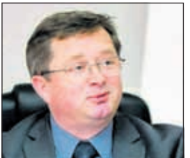
Džakula: UO obaviješten o isteku mandata