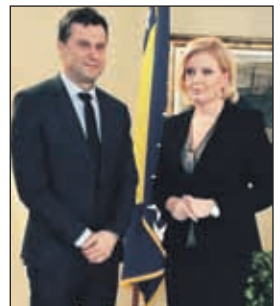
Novalić otkriva na koju lokaciju se seli Vlada FBiH