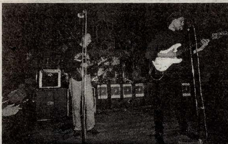
■ Beastly Stroke