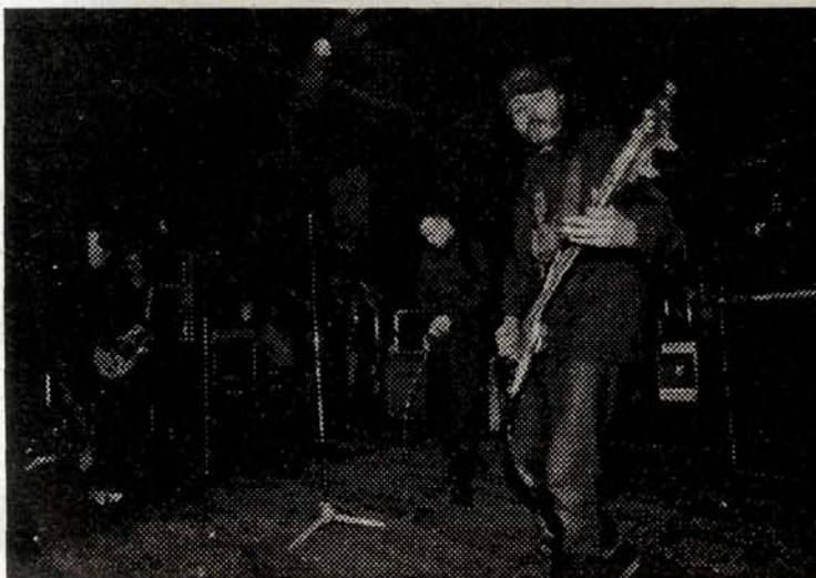
■ Lezl Majmune!